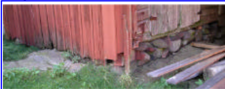
Panelen går ända ner till mark och är rötskadad