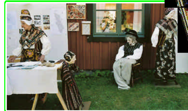
Visning av Runödräkter på Mattsgården i juli 2005