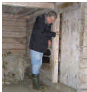
Planering av sjöbod- renoveringen 2005