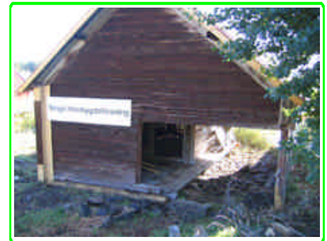
Mattsgårdens sjöbod vid Backbyfjärden renoverades 2005